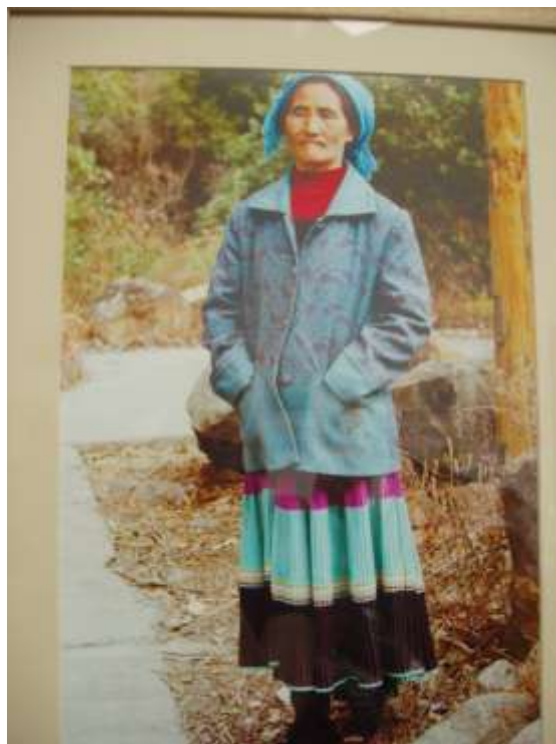
Pár fotiek z mnohých z výstavy.