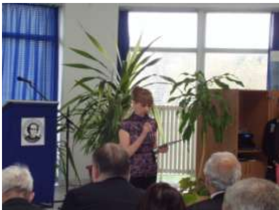
Zástupkyňa riaditeľa privítala všetkých zúčastnených.