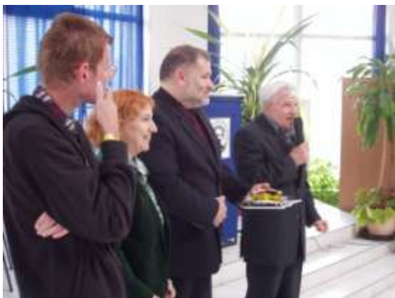
Slávnostný krst tohtoročného zborníka.