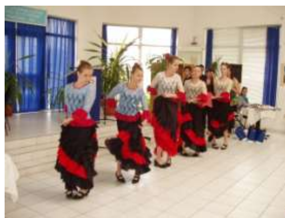
Tanečnice zaujali svojím tancom celé publikum.