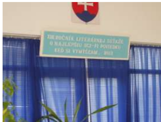
V tomto roku sa uskutočnilo vyhodnotenie už 13. ročníka o najlepšiu scifi poviedku.