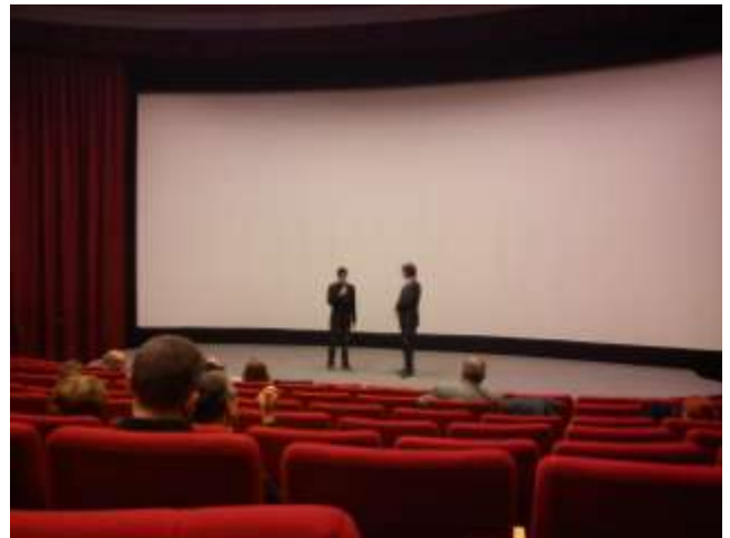
Tvorcovia filmu tesne pred začiatkom premietania v kine Hviezda v Trnave