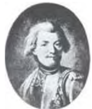
Móric August Beňovský